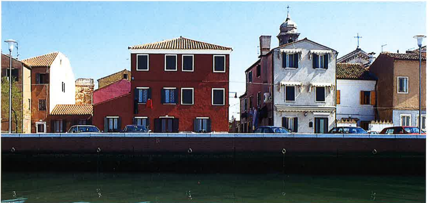
Un tratto di riva prima e dopo gli interventi e la relativa sezione tipo con i particolari costruttivi