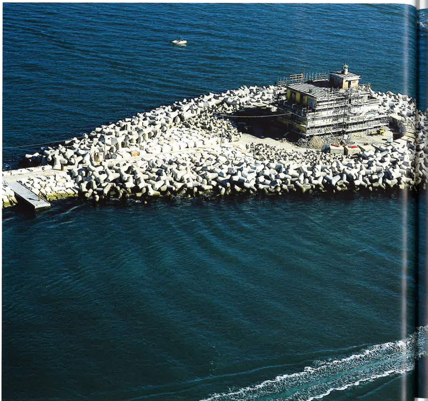
In alto Lavori per l'adeguamento del faro, al termine degli interventi di ristrutturazione del molo