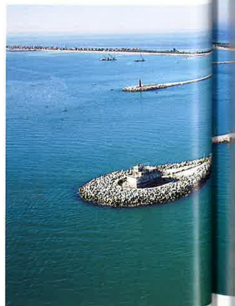
A destra I moli di Malamocco, visti da nord verso sud, a lavori ultimati e un tratto del molo nord all'inizio e al termine degli interventi di rinforzo della scogliera